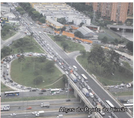
Alças da Ponte do Limão